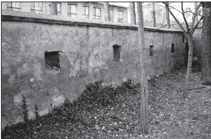
2. sz. ábra A templom kerítésfala